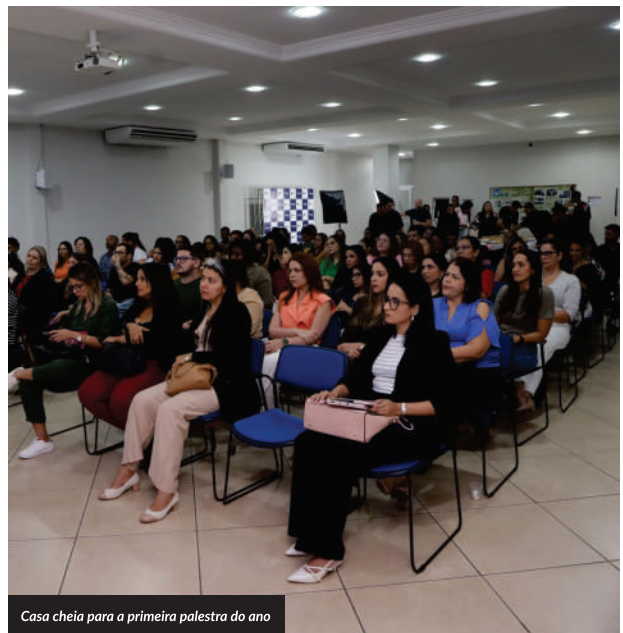
Casa cheia para a primeira palestra do ano